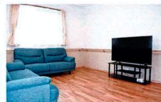
団らんスペースとして