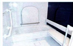
入浴介助ができる浴室