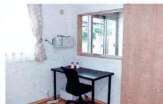
24時間体制で見守る事務所